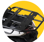
Support caisson ultra-résistant