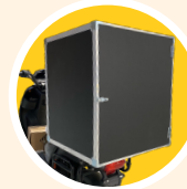
Caisson Flight sur mesure