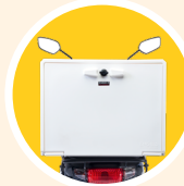
Caisson 120 L