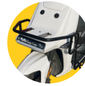
Kit de protection antichoc en option