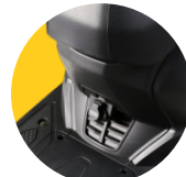
Prise sous selle