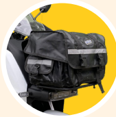
Sacoche imperméable Avant / Latérale