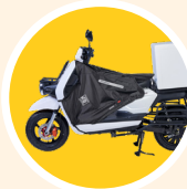
Jupe de protection Tucano